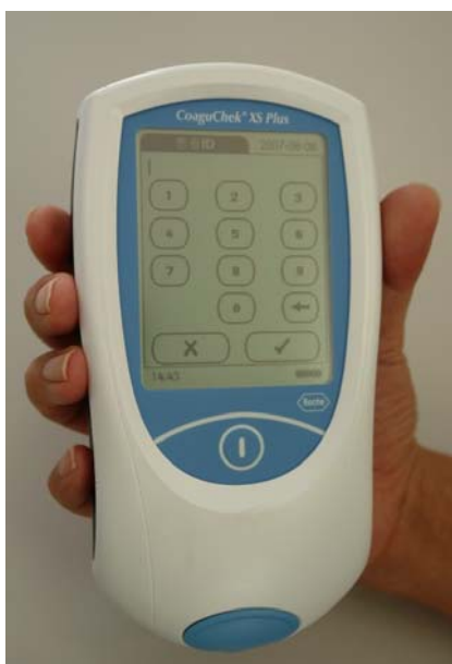
コアグチェック XS Plus (患者ID入力画面)