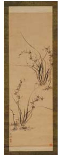
蘭画 木村兼葭堂画 江戸中期

標本の分類をシーボルトに賞賛された門人の水谷豊文や、海外での日本の植物書『日本植物誌(フロラ・ヤポニカ)』をもとに『泰西本草名疏』を著した伊藤圭介、さらには江戸時代最大の植物図鑑『本草図譜』を著した岩崎灌園、リンネの分類法でまとめられた植物図譜『草木図説』を著した飯沼慾斎、当時としては最先端の西洋植物学の解剖図や用語などを『植学啓原』で紹介した宇田川榕菴など後に続く者たちが西洋植物学の考え方を本草学に取り入れていきました。明治から昭和に活躍した近代日本を代表する植物学者である牧野富太郎へと、その流れは途切れることなく継承されていきました。私たちが普段あまり耳にすることのない本草学が近代の自然科学の礎となっているのです。