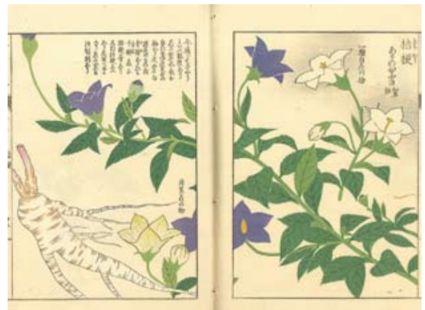
『本草図譜』96巻 岩崎灌園著 天保元年-弘化元年(1830-1844)成立 大正5年-11年(1916-1922)に刊行されたもの。