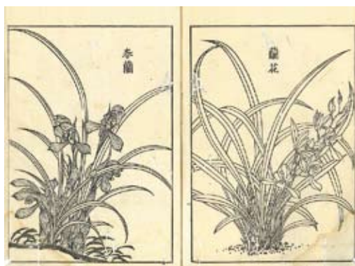
『怡顔齋蘭品』松岡恕庵著 小野蘭山画 明和9年(1772)師・松岡恕庵が蘭の品種についてまとめた本において、植物画の才能を発揮している。

薬効ではなく、自然物の種類によって動植物を分類した本草書。中国・日本の本草学に大きな影響を与えた。