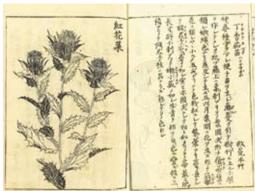
『花彙』小野蘭山・島田充房共著 宝暦13年(1763)

精緻な植物画はとて美しく、優れた植物図鑑として高い評価を得て、フランス語に訳されパリでも出版された。