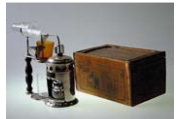
(左)吸入器 展示予定の資料のひとつで、昭和12年のもの。

内藤記念くすり博物館の資料のうち、幕末から昭和初期にかけての医薬に関するものが、産業近代化の過程で大きな意義を持つとして経済産業省により近代化産業遺産に認定されました。これを記念して2009-2010年に12回にわたって認定された資料を毎月紹介する展示を行っていましたが、ご好評につき、新たに資料を展示します。ぜひご覧ください。