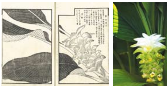
(写真左)『草木図説』飯沼慾斎著 安政3年(1856) ウコンを記載したページ。右の写真と比較すると、その写実性がよくわかる。 (写真右) ウコンの花