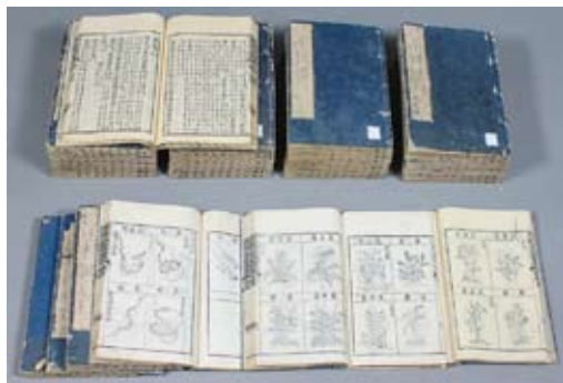
『本草綱目』李時珍著 1603(万暦31)序

蘭山は、享和元年（1801）から文化2年（1805）まで6回、関東を中心に14ヶ国を回り、その記録は採集記録として幕府に提出された。