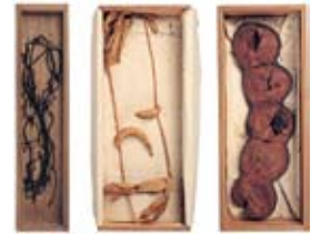
(写真左より) 鶴毛(鶴の羽)、魚尾竹(フジウツギ)、象豆莢(モダマ) 尾張薬品会に出展されたと思われる生薬類。

有鱗類の哺乳動物で、鱗状の皮膚を催乳剤に用いる。尾張医学会にもこのような剥製が多数展示された。