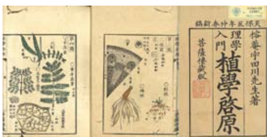
『植学啓原』宇田川榕菴著 天保5年(1834)