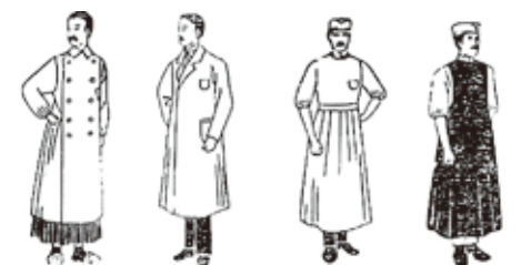
昭和初期の医師の診療衣と手術衣