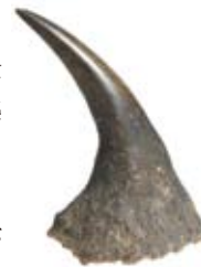
生薬・烏犀角 麻疹の際に解熱剤に用いられました。

麻疹は疱瘡と同様、生涯に一度麻疹にかかれば再びかかることがなく、免疫ができた人の数が多い間は大規模な流行は見られず、15～20年間周期で流行しました。そのため医師が麻疹の患者を診察することは生涯に一、二度であり、治療経験が少ないために治療が難しかった一面もあったようです。