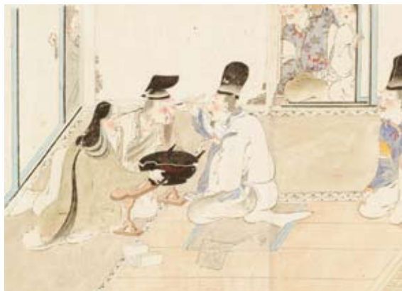
平安時代の眼病治療の様子

江戸時代には漢方医学や、オランダから伝わった蘭方医学が発達し、多くの医師がさまざまな病気治療に取り組みました。幕末にはコレラが伝来して猛威をふるったほか、明治時代には工場や軍隊を通じて、労咳(肺結核)の感染が拡大し、日本の医師は、ドイツやイギリスを通じて西洋医学を吸収し、病気の治療を推し進めていきました。