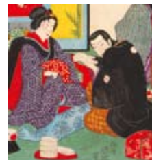
和装の医師 (明治時代)