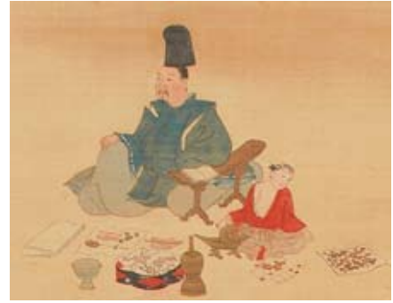
丹波康頼 (912-955) (上)

江戸時代になると、五代将軍・徳川綱吉の頃に将軍やその家族等を診察する侍医をはじめとする医師団が構成され、医官制度が整えられました。当時は、公の医療制度や医学教育のための学校というものを幕府が設けていなかったため、さまざまな方法で医師になることができました。