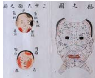
『疱瘡面部伝』 天然痘の症状を図で示した本

疱瘡の研究が進んだのは17世紀半ばで、中国・明代の医師であった戴曼公 たいまんこう は日本に疱瘡の治療の秘訣を伝えました。1796年にイギリスの医師・ジェンナーが牛痘接種法を発見し、嘉永2年（1849）には日本にも伝わり、各地の医師らにより予防接種が勧められました。