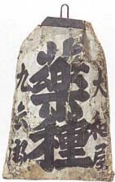
袋看板 大和屋久兵衛/ 岐阜/江戸/95×60×30 薬袋をかたどった看板。