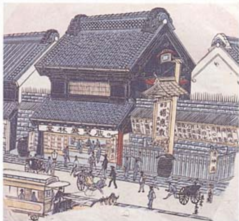
廻応散[うちわ絵広告] 佐野盛林堂/東京/明治/21.5×23.5 広告入りのうちわは、夏にお得意様へ配られた。建看板や掛看板などが飾られた立派な店構えが描かれている。

制作には費用がかかることから、逆に多くの錦絵広告を生み出した当時の薬業界は、潤沢な資金があったといえるでしょう。文化的側面から見れば、江戸時代の広告業界において、薬屋は錦絵やその他の広告文化を育てる一端を担っていたのかもしれない。