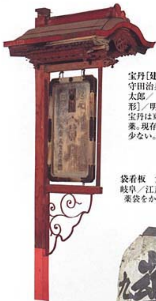
宝丹[建看板] 守田治兵衛/高野万太郎/[東京]・[山形]/明治/106×60 宝丹は東京・池之端の薬。現存する建看板は少ない。