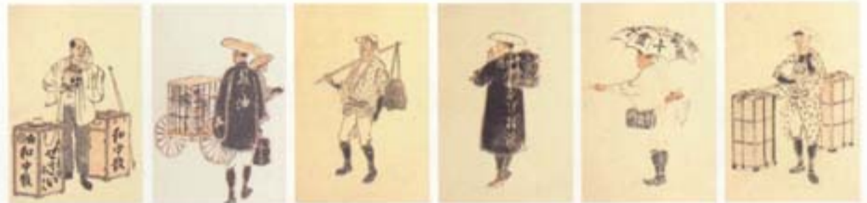
[明治商売絵]左よりぜさい売り・熊の油売り・赤蛙売り・そげ抜き売り・千金丹売り・もぐさ売り 明治/22×15

昔は薬は店だけでなく、行商人によっても販売されていました。富山の配置売薬の行商人のように受け持ち区域のお得意さんを回る行商人もあれば、定賣売りや枇杷葉湯売りのように、市街を売り歩く行商人もありました。