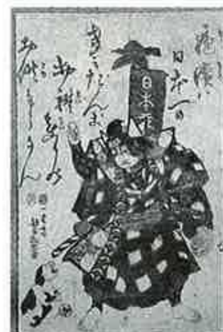
◀赤絵 桃太郎と犬が描かれ、後ろには「疱瘡は日本一のきびだんご お礼まいりのお供申さん」と書かれている。安政4年(1857)〈30×20〉