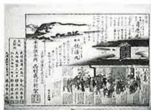
◀奇応丸・快通丸 店の周りに集まった人々が、薬をほめる様子を描いた錦絵広告。京都・西村峯洋軒／明治時代〈37.6×52.8〉