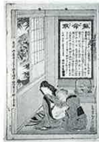
◀蘇命散 産婆さんがお腹の大きな女性を診ている図。背景の掛け軸の中に薬の効能が書かれている。京都・福田／明治時代／〈37.2×25.7〉