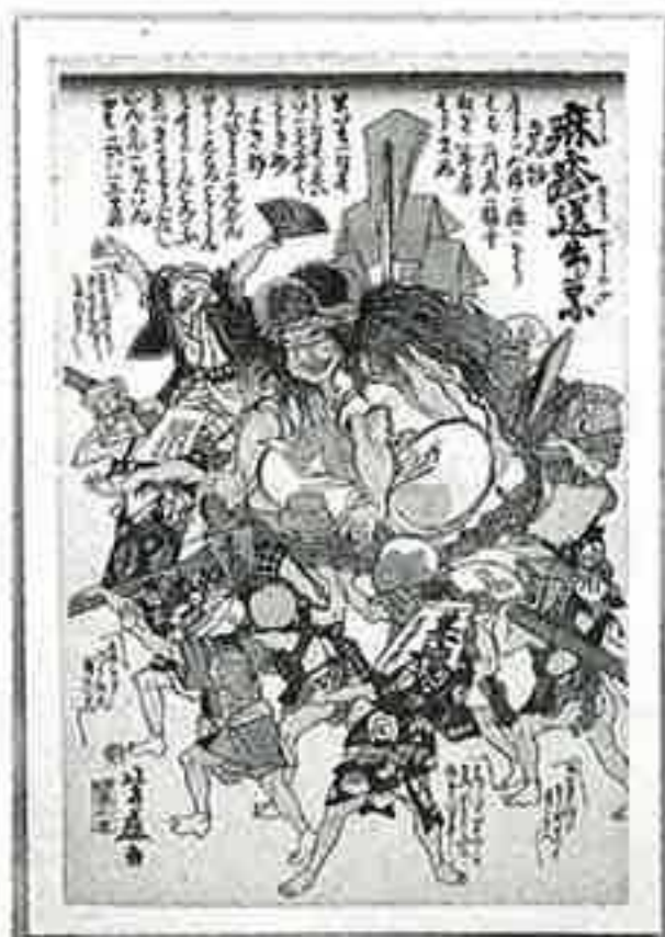
◀麻疹送り出しの図 人々のはしかの神を棧俵(さんだわら)に乗せて町から追い出す様子が描かれている。棧俵は俵の両端にあてる丸いわら製のふたのこと。文久2年(1862)／芳藤画〈39.6×24.9〉