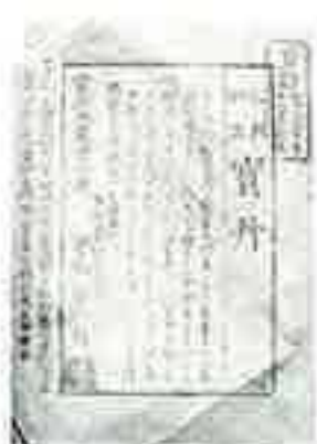
◀▶ 宝丹 (明治 / 31.3×46)

効能書と包みとが兼用になっており、折りたたむと右のようになります。このような形であれば、効能書を失わずにすんだことでしょう。