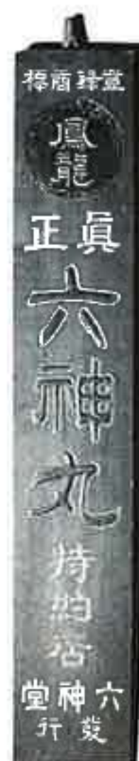
▶ 六神丸 (大正～昭和 / 85×15)