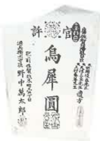
▶ 烏犀円 (明治 / 23×17)

肥前の鍋島藩では、富山のくすり売りが隠密化したため、他藩の行商人による配置売薬を禁じました。しかし烏犀円の評判がよいため、藩命で野中家が作り始めました。