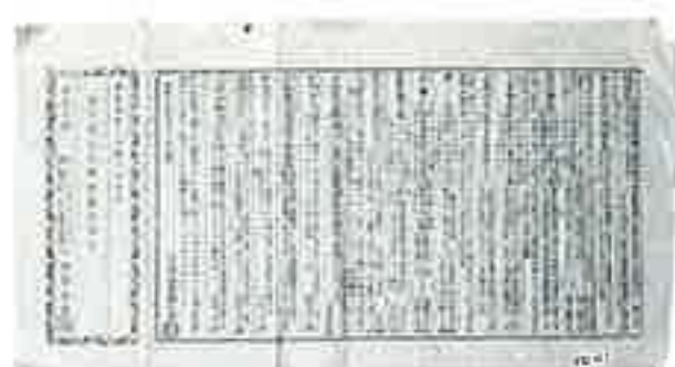
▶ 宝丹売弘用 附属品定価表 (明治10年 / 18×34)

明和～天明年間 (1764～1788年) に発売された「ウルユス」を売り広めるための手引書が、『ウルユス弘方心得書』です。製造元と卸元との連名で、ウルユスの販売店に広め方を指導したもので、口コミが効果的であるとか、ちらしの配り方など12項目にわけて書かれています。