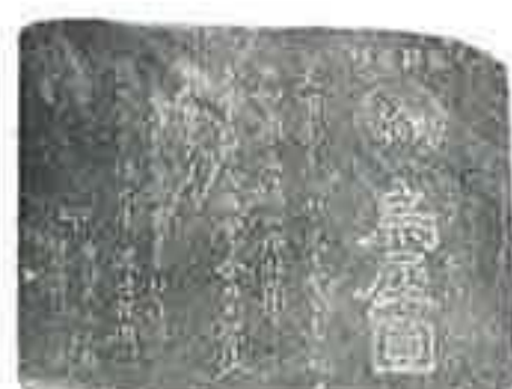
◀ 烏犀円 (明治～大正 / 20.3×27) “肥後” 烏犀円の置看板です。

紫雪は“加賀の三大秘薬”のひとつですが、加賀の薬種商の福久屋と中屋が藩主に願い出て調合の許可を得て作りました。