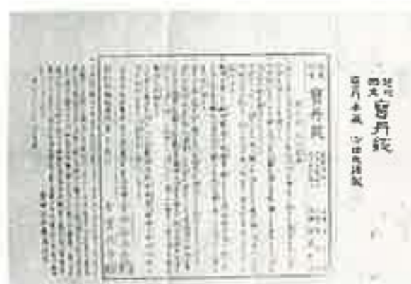
◀ 宝丹錠 (明治時代 / 13×8)

『宝丹錠ハ明治十年府下熱田彦兵衛ナルモノノ、求メニ因リ原品宝丹ヲ分チ以テコレヲ製セシムル所ナリ故ニ其効大薬宝丹ニ等シケレバ…』 効能書には、要望に応じて錠剤を販売するに至った経緯が書かれています。