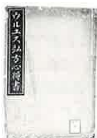
◀ 「ウルユス弘方心得書」