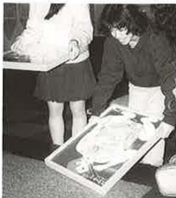
できるかな？ 迷路ゲーム

いままでのカロリー計算と紙風船のコーナーに加え、人体パズルや人体迷路ゲームなど、楽しみながらためになるゲームが登場しました。特別展の開催初日から子供たちに大人気！ と思いきや意外と大人も熱中してしまうコーナーです。このほかにも、自動血圧測定器・握力計・全身反応測定器、そして身長と体重のほかになんと肥満度まで教えてくれる身長体重計が新しく入りました。この機会にぜひチャレンジして、自分の“健康”をチェックしてみましょう。