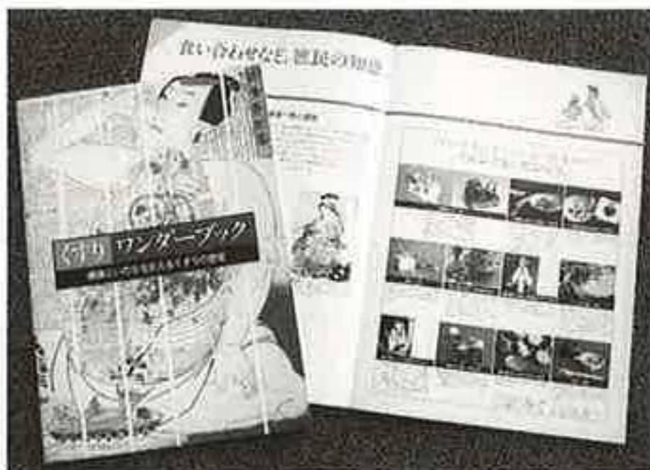
▶くすりワンダーブック 500円 ▶健康手形 300円

◆◆◆ 販売物のお知らせ ◆◆◆ 郵送もできます(送料は申し込み者のご負担になります。お申込みはハガキでどうぞ)