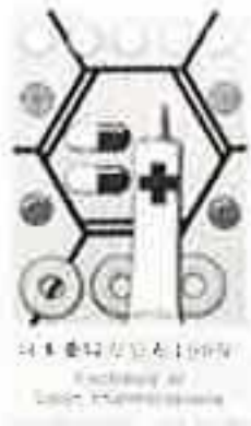
▲日本薬局方公布100年初日カバー