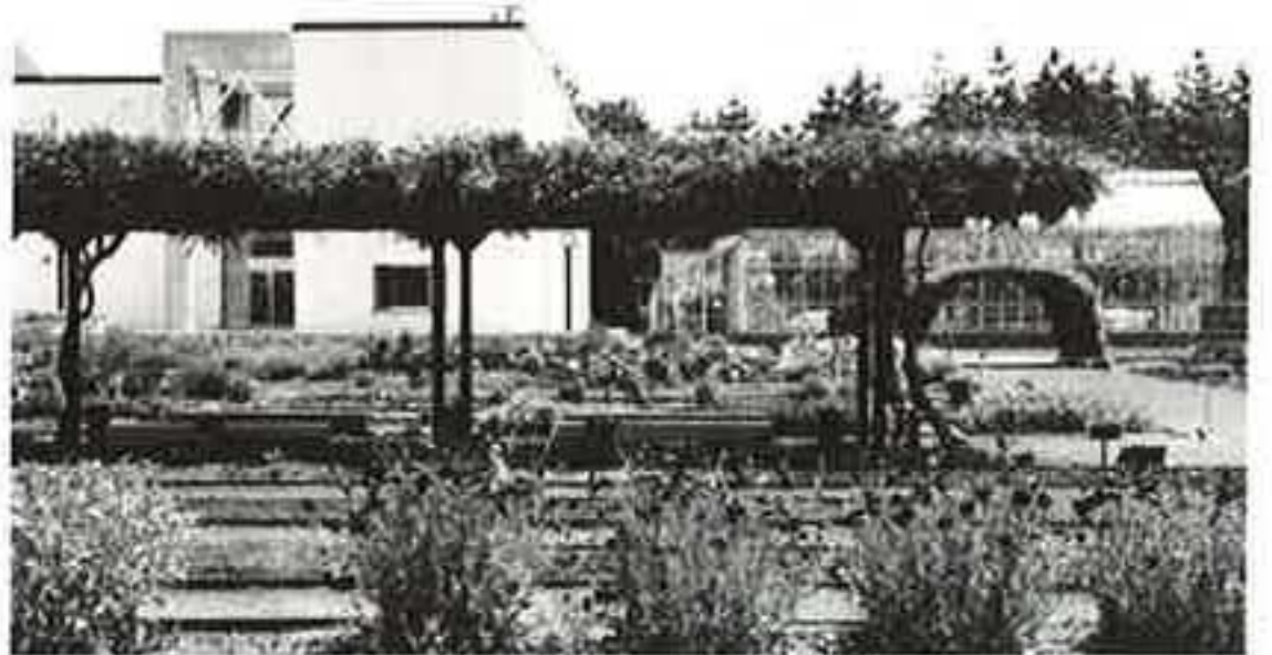
▲上 説明を熱心に聞く女子学生 下 藤棚