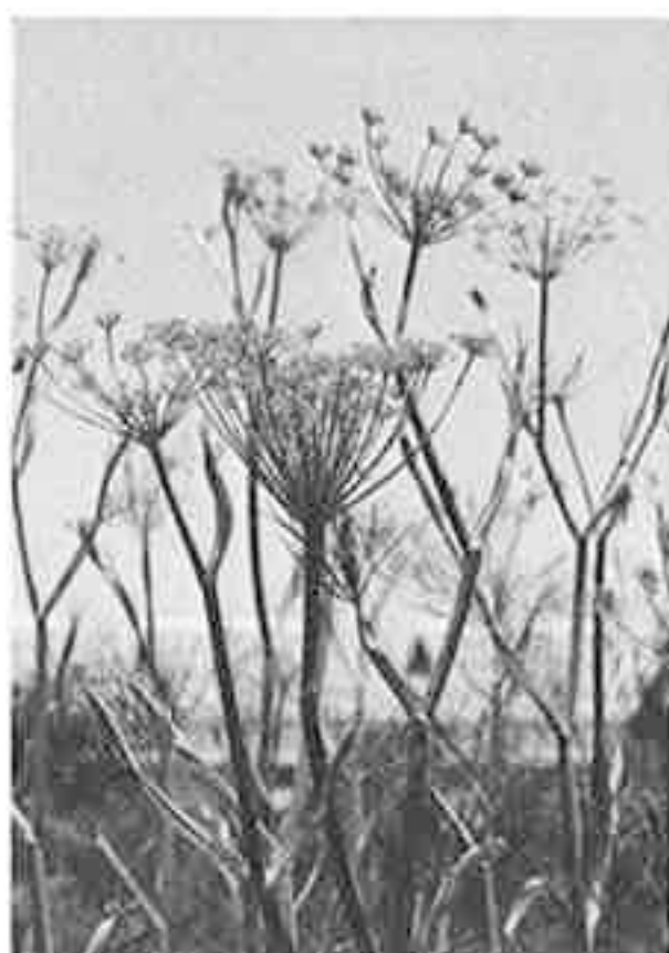
▲薬草園に咲くフェンネル

地中海沿岸原産のセリ科の多年草です。ヨーロッパ、アジアはもちろんのこと、北アメリカでも広く栽培され、わが国では主に北海道や長野