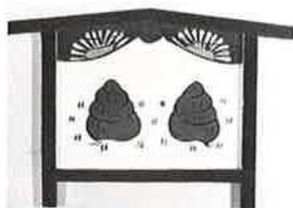
(埼玉、菅谷田螺不動)

「この絵馬は何の病気平癒に使われるのでしょうか」正解は眼の病です。この一見怪しげな絵、実は田螺で、農家の人が昔、稲穂で眼をついた時田螺を禁食して回復を待ったことに由来しています。