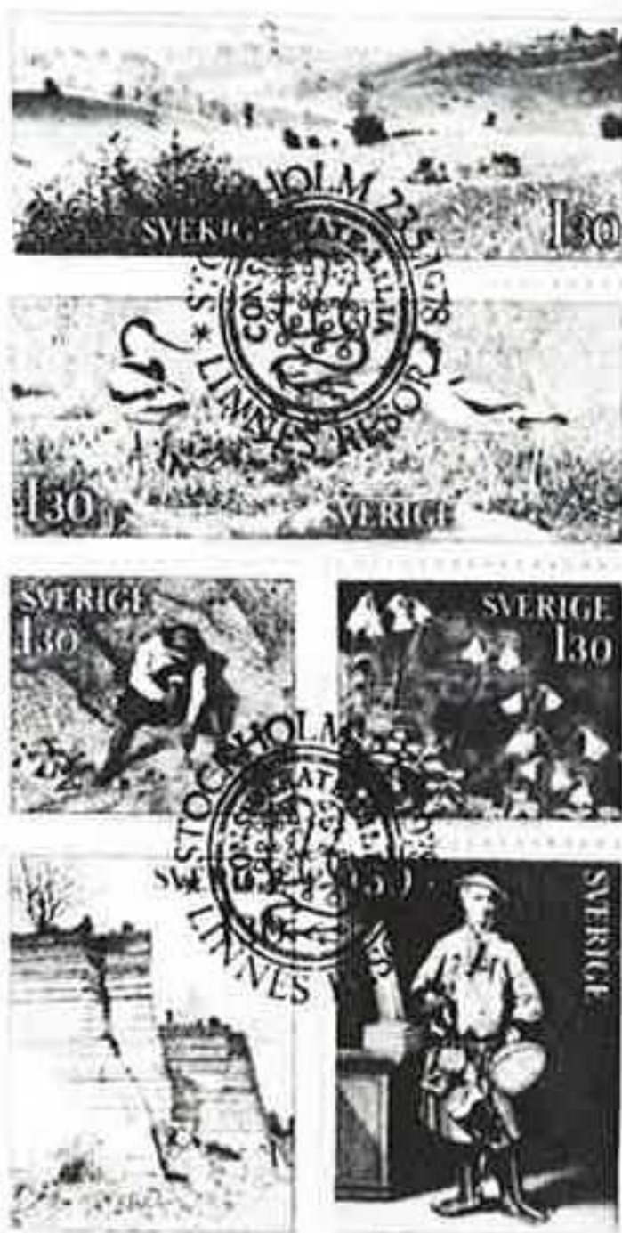
▲植物学者リンネ没後200年記念 (スウェーデン・1978)

展示総数は3,115枚(切手シートや初日カバー・切手帳も1枚と数え、重複なし)です。国内の切手はもとより世界140カ国の切手があります。