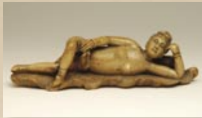
診断用の女性の人形